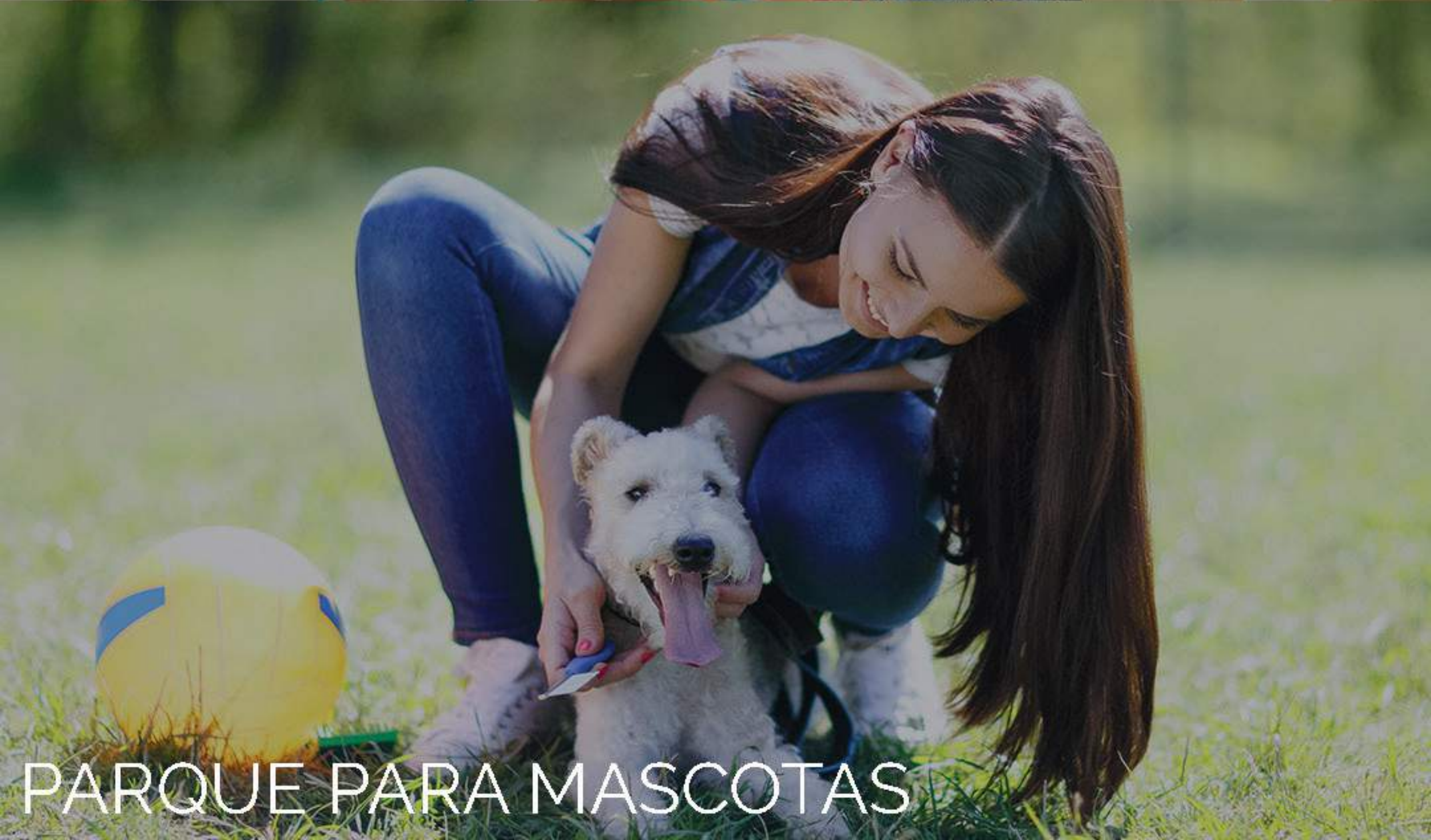
PARQUE PARA MASCOTAS