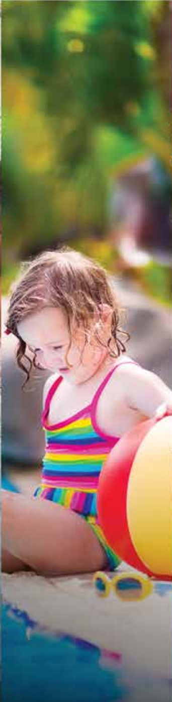
PISCINA PARA NIÑOS