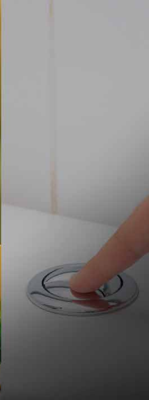
INODOROS DE BAJO CONSUMO EN CASAS Y ÁREAS COMUNES