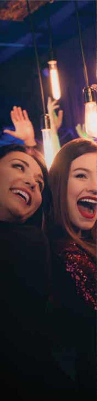
SALÓN DE EVENTOS