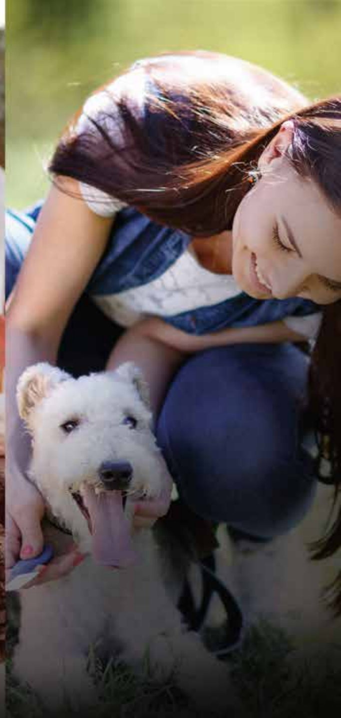
PARQUE PARA MASCOTAS