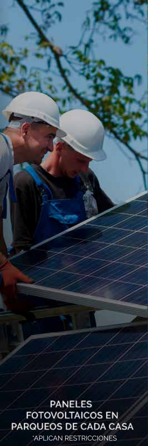
PANELES FOTOVOLTAICOS EN PARQUEOS DE CADA CASA