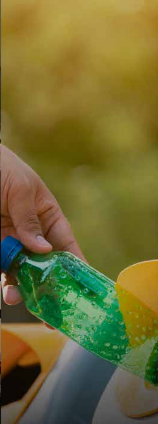
CAMPAÑAS DE RECICLAJE, REDUCCIÓN Y REUTILIZACIÓN DE DESECHOS