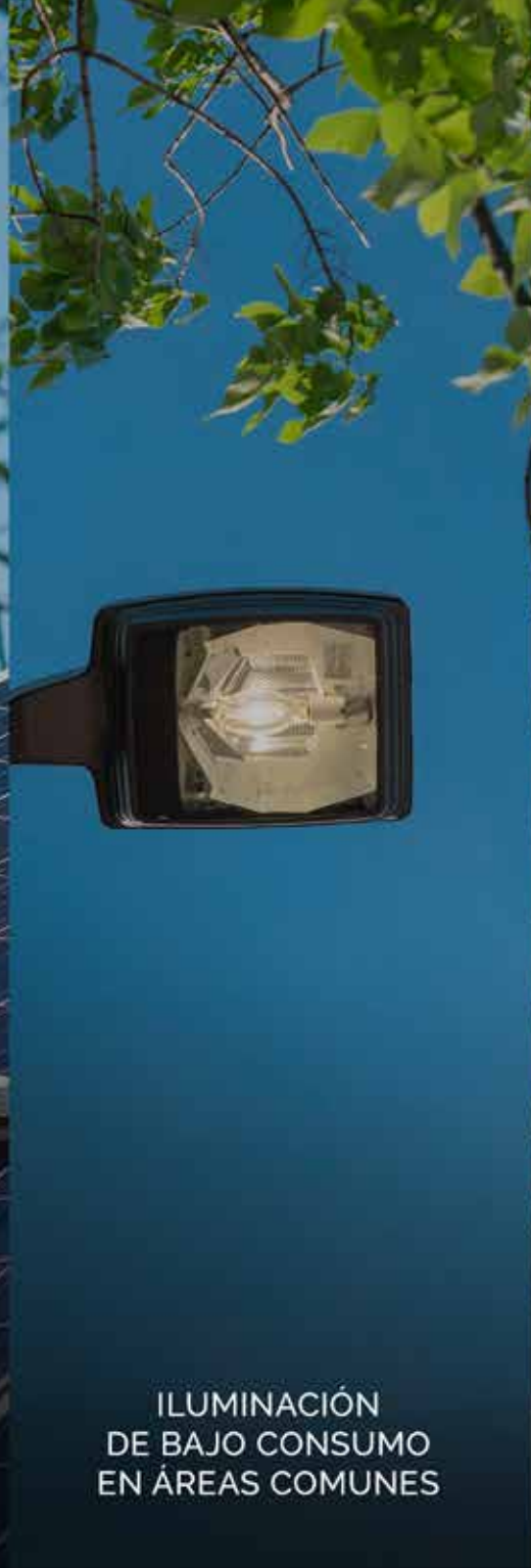
ILUMINACIÓN DE BAJO CONSUMO EN ÁREAS COMUNES