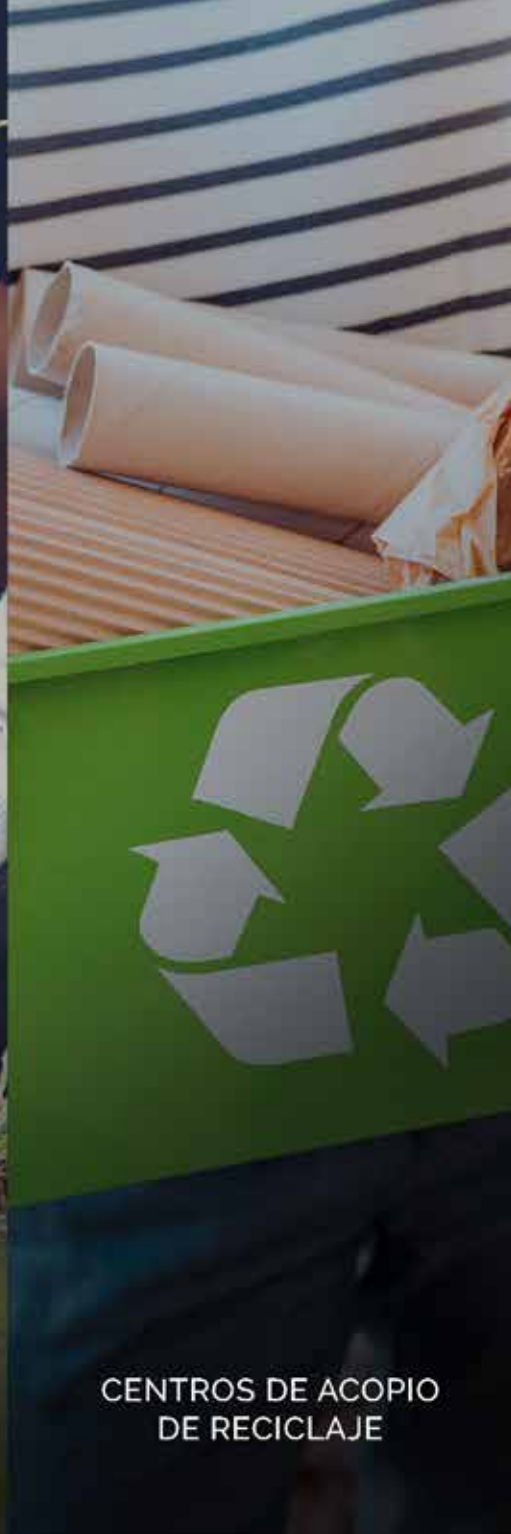
CENTROS DE ACOPIO DE RECICLAJE