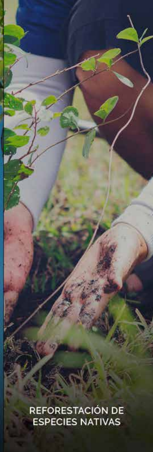
REFORESTACIÓN DE ESPECIES NATIVAS