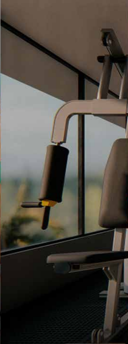
VIDRIOS CON PROTECCIÓN SOLAR EN ÁREAS COMUNES