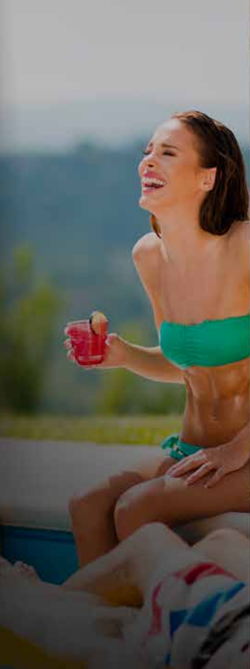
PISCINAS TEMPERADAS POR MEDIO DE PANELES SOLARES