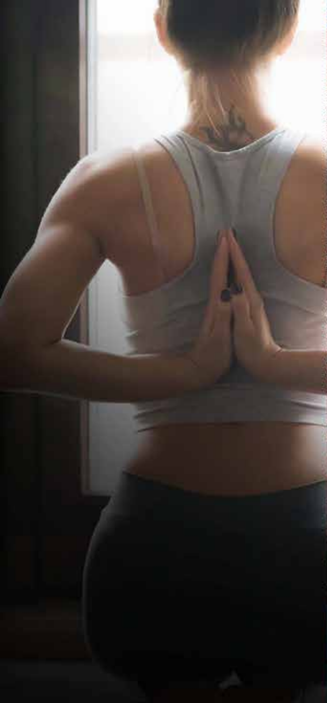
DECK DE YOGA