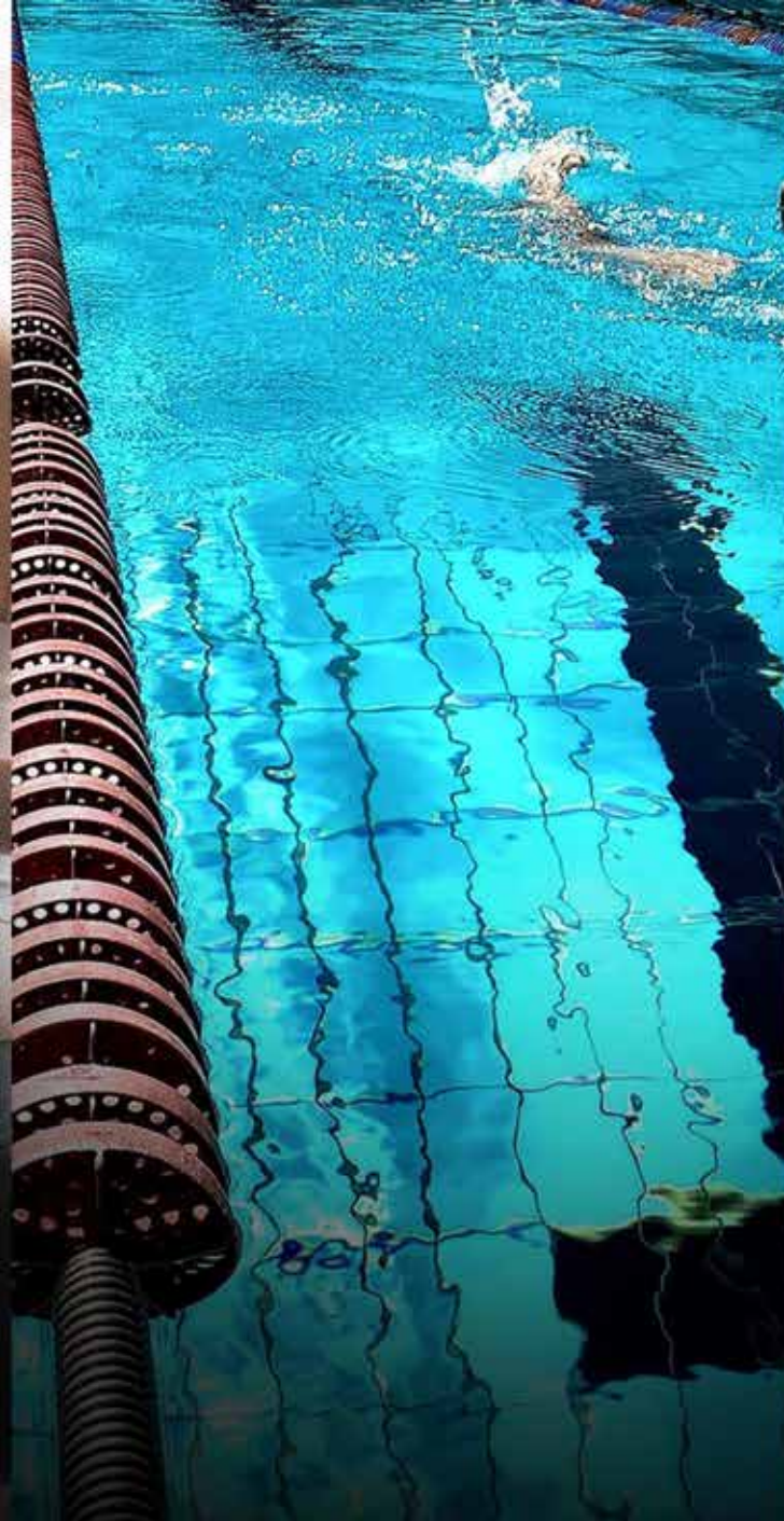
CARRIL DE NADO